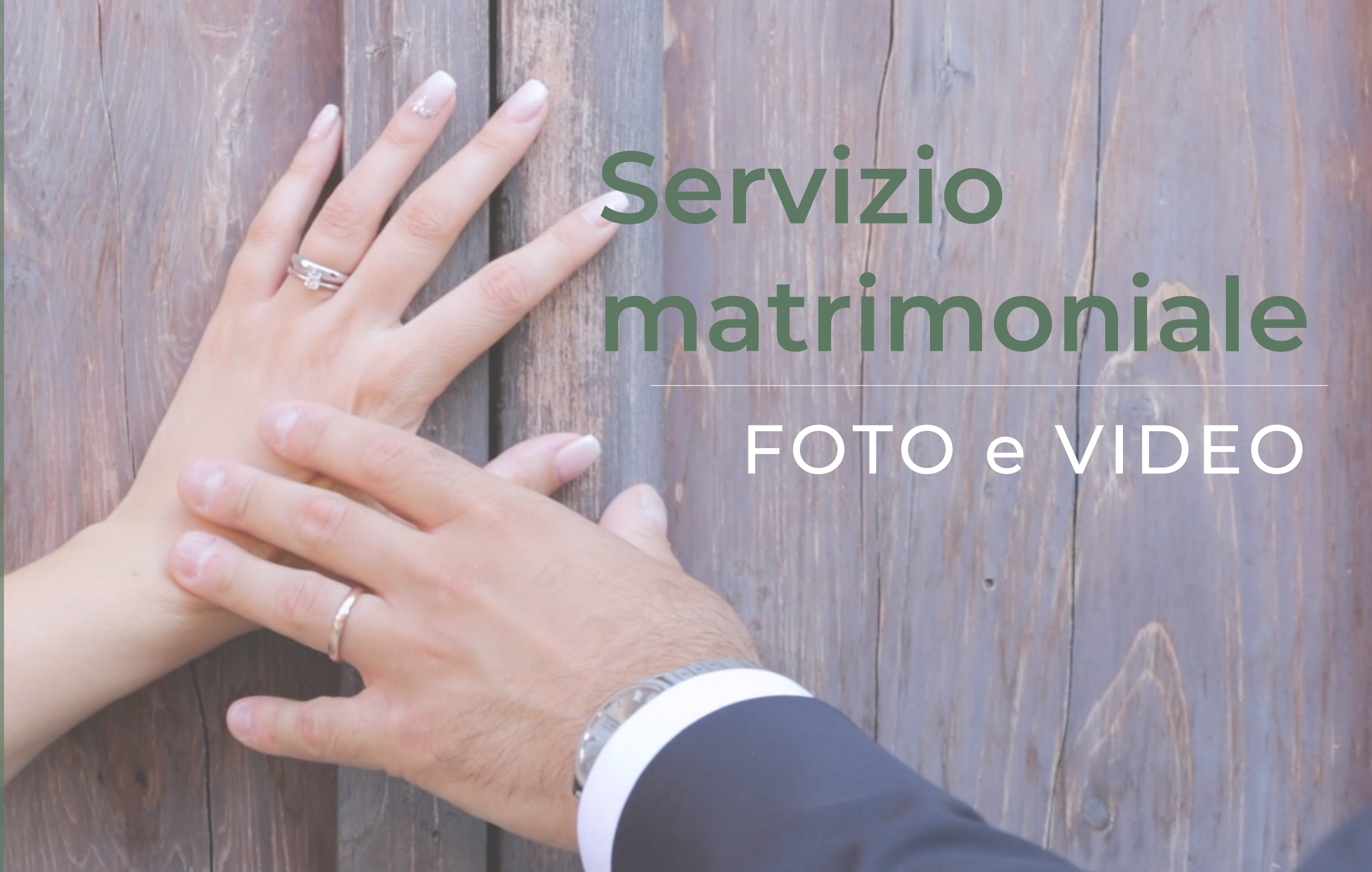
FOTO e VIDEO